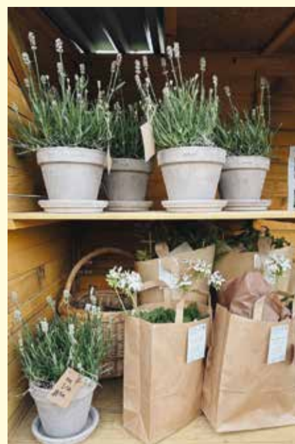
Blomsterkiosken står öppen fre-sön under blomstersäsongerna. Övrig tid går bra att beställa.