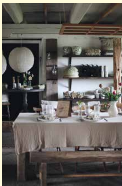
I butiken finns utvald inredning och hantverk från lokala förmågor.