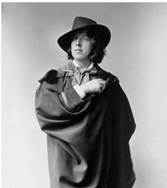
Utställningen Dandyn - ett stilsamt uppror är en hyllning till stilen, skärpan och det stillsamma upproret.

I sommar bjuder Säfstaholms slott in till två större konstutställningar där samtida uttryck möter historiska perspektiv. Utställningarna invigs den 13 juni och pågår hela sommaren fram till slutet av september.