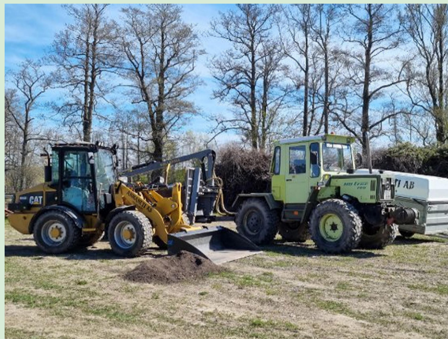
En stor del av Anmanetis maskinpark.

Magnus gör en kortare paus; ”Vid stubbfräsning kan en sten kan fara iväg långt och träffa någon eller något. Jag arbetar alltid förebyggande och planerar arbetet för att inget ska inträffa. Skulle