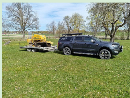
Stubbfräsen har ett uppdrag och är redo för transport.