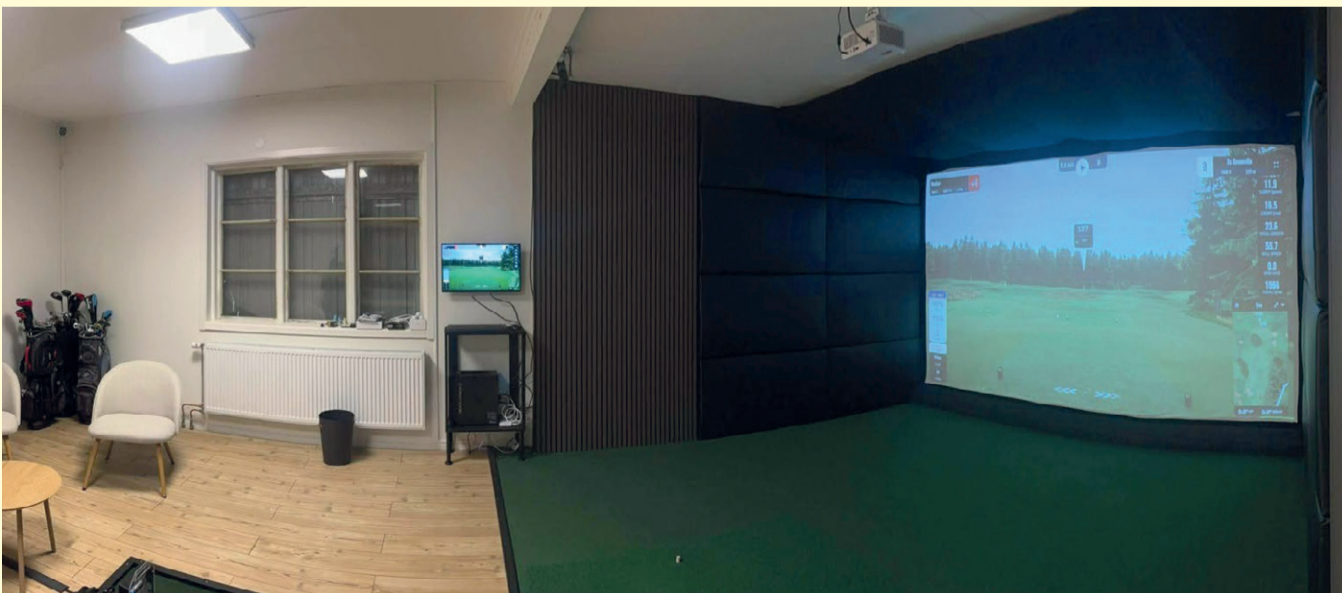
Golfsimulatoren funkar för både nybörjare och erfarna golfare.