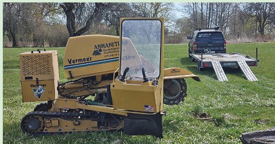
Stubbfräsen ska lastas inför avfärd.