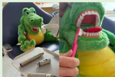
Bolibompadraken är ett fint pedagogiskt hjälpmedel som används vid behandling av små barn