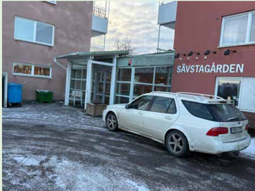
Pensionärsföreningarnas gemensamma lokaler finns på Sävstagården.